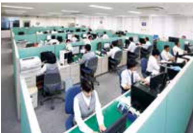
専門スタッフがチームでサポート