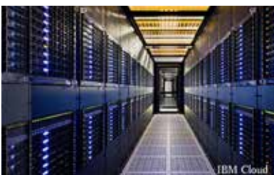
災害などに備え、データを守り抜く