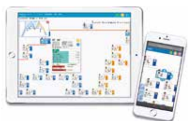
大好評の「ナビゲーションマップ」